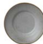
Plate 17 pack de 6 17 x 3.7 cm 6.69 x 1.45 in ● Luna 13056 ● Limestone 14633 ● Kambaba 12028