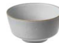
Cereal Bowl pack de 4 15 x 8.5 cm 5.9 x 3.3 in ● Luna 13032 ● Limestone 10857 ● Kambaba 12004