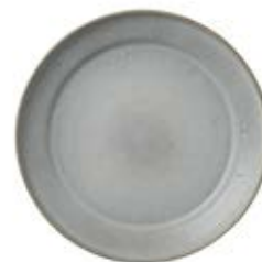
Plate 26.5 pack de 4 26.5 x 3.5 cm 10.4 x 1.3 in ● Luna 13018 ● Limestone 10833 ● Kambaba 11984