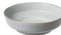
Bowl 21 pack de 6 21.5 x 6 cm 8.46 x 2.36 in ● Luna 13087 ● Limestone 14640 ● Kambaba 12059