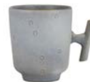
Mug pack de 6 13.5 x 9.7 x 11 cm 5.3 x 3.8 x 4.33 in