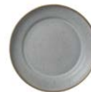
Plate 22 pack de 4 22 x 3.5 cm 8.6 x 1.3 in ● Luna 13025 ● Limestone 10840 ● Kambaba 11991